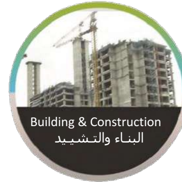
Building & Construction البناء والتشييد