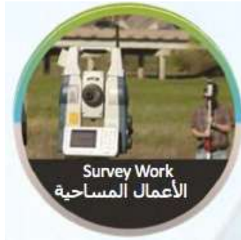
Survey Work الأعمال المساحية