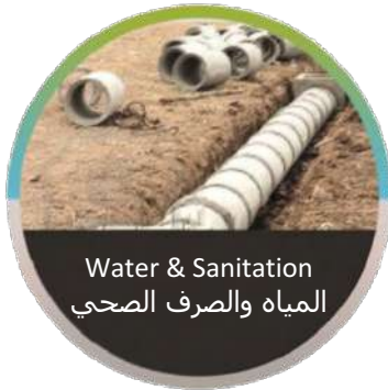
Water & Sanitation المياه والصرف الصحي