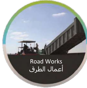
Road Works أعمال الطرق